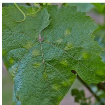
Macchie su pag. superiore

Dopo la fase di allegagione, attacchi di questo parassita originano la sindrome conosciuta come peronospora larvata , che rimane insediata all'interno degli acini, determinando colorazione bruna e avvizzimento dei frutti.