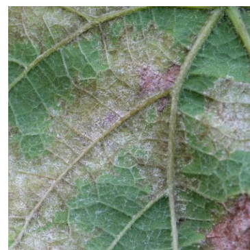
Macchie sporulate, pag. inferiore