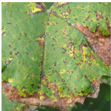
Peronospora a mosaico