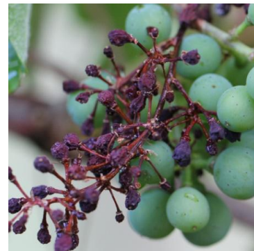
Grappolo con Peronospora larvata