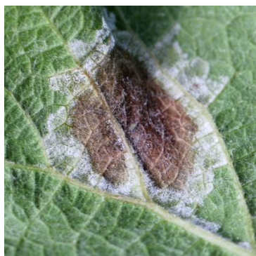
Macchia sporulata, pag. superiore