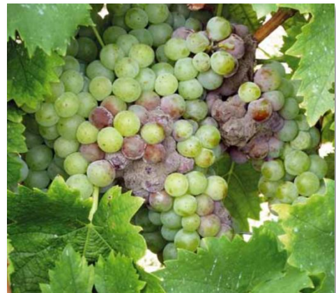
Microclima umido e patogeni fungini