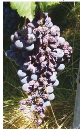
Danni da scottature solari