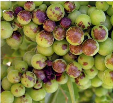
Danni da scottature solari